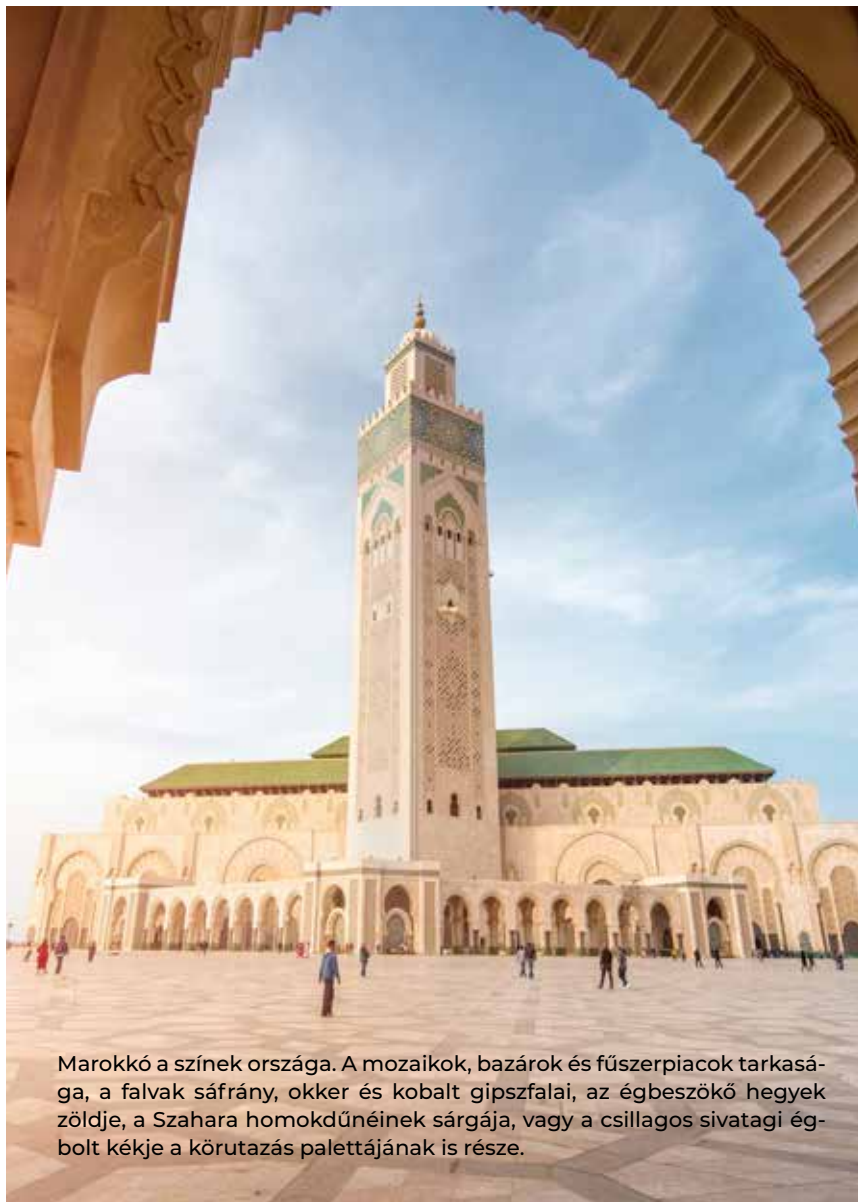
Marokkó a színek országa. A mozaikok, bazárok és fűszerpiacok tarkasága, a falvak sáfrány, okker és kobalt gipszfallai, az égbeszökő hegyek zöldje, a Szahara homokdűnéinek sárgája, vagy a csillagos sivatagi égbolt kékje a körutazás palettájának is része.

6. nap Erfoud – Merzouga • Szabadprogram, pihenés a szállodában, majd átkelés a fekete sivatagon, a Párizs-Dakar rali kalandos útvonalát követve. Látogatás a helyi nomádoknál, majd Khamliában a szudáni fekete bербerek törzsi zenéje szórakoztatja a látogatót. Továbbutazás Merzougába, vacsora és szállás reggelivel a homokdűnéknél elhelyezkedő sátrakban.